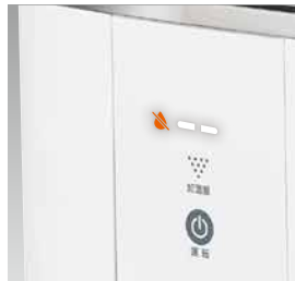
LED表示(加湿量・給水ランプ)