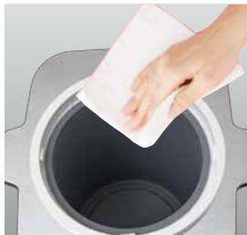
お手入れ簡単広口容器