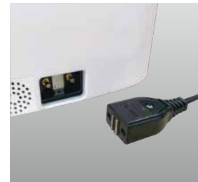
安心安全マグネットプラグ